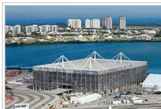
Olimpijala Stadio por Aquala Sporti, en Barra da Tijuca.