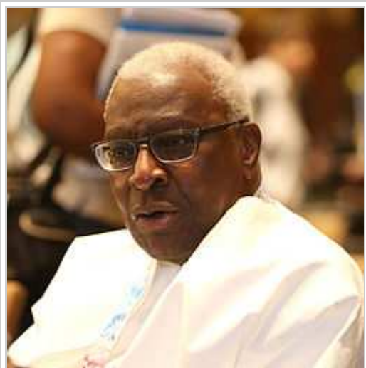
Lamine Diack, ex-prezidanto di la Federuro Internaciona pri Atletismo - IAAF.

Ye la 9ma di novembro 2015, divulgesis 323-pagina inquesto pri l'uzo di drogi dal Rusa atleti. [4] La inquesto montris quale atleti, entrenisti, kelk arbitreris, kelka personi qui facis la testi pri uzo di drogi, e mem kelka membri di la Federuro Internaciona pri Atletismo - IAAF - respektive uzis, furnis, falsigis la kolekto di specimeno por testar l'uzo di drogi, falsigis la rezulti di testi ed/od omisis la pruvu pri l'uzo di drogi en diversa okazioni. [4] Segun l'inquesto, la Ministerio Rusa pri la Sporto "komandis, kontrolis