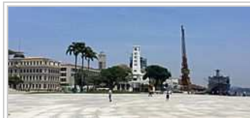
Placo Praça Mauá , 2015.