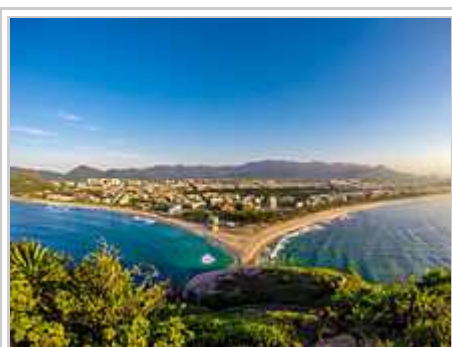
La peninsuleto Pontal, loko por la starto dil konkursi pri atletala marcheo.

La maxim multa konkursi pri atletismo eventis en la stadio João Havelange , anke konocota kom Engenhão , en la quartero Engenho de Dentro, en la norda parto dil urbo. La stadio João Havelange inauguresis en 2007 por la Tot-Amerika Ludi ed