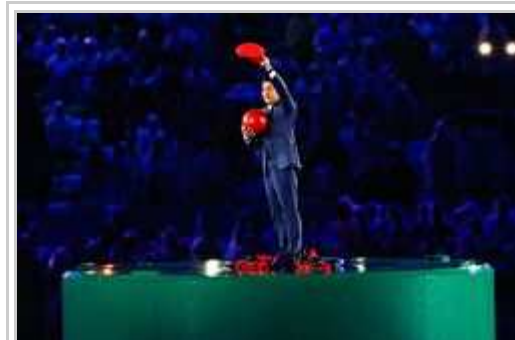
Chefministro di Japonia Shinzo Abe arivas en la stadio, vestizita quale Mario .