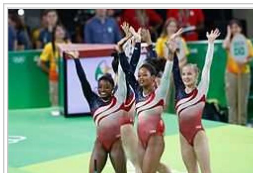
Usana esquadro pri Olimpiala gimnastiko por mulieri. Sinistre, Simone Biles.